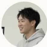
エンジニア 入社 3 年目