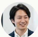
マネージャー 入社 18 年目

お客様と話しながら、「こういう仕組みにした方が使いやすいのでは」と提案することもあります。その提案が実際に採用されて、現場でシステムが使われているのを見るととても嬉しいですね。実際のユーザーと対話しながらシステムを作れるのは、この仕事の魅力だと思います。